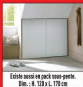
Existe aussi en pack sous-pente. Dim. : H. 120 x L. 170 cm