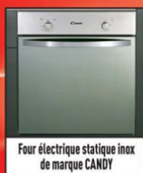
Four électrique statique inox de marque CANDY