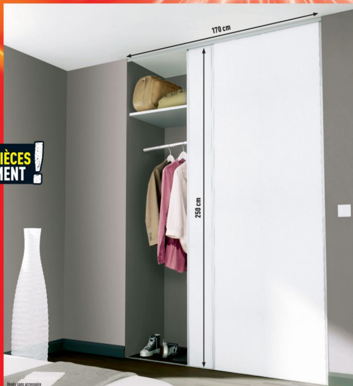
Vendu sans accessoire