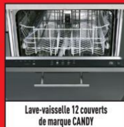
Lave-vaisselle 12 couverts de marque CANDY