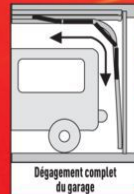
Dégagement complet du garage

* Moteur et quincaillerie garantis 2 ans - à monter soi-même.