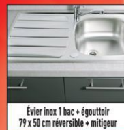
Évier inox 1 bac + égouttoir 79 x 50 cm réversible + mitigeur