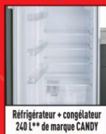
Réfrigérateur + congélateur 240 L** de marque CANDY