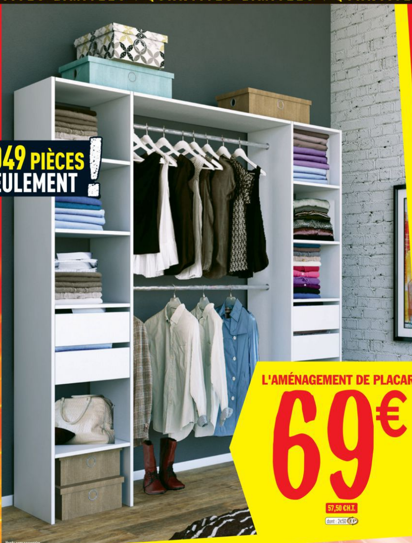
Vendu sans accessoire