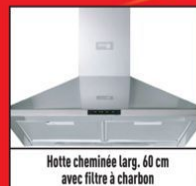
Hotte cheminée larg. 60 cm avec filtre à charbon