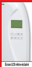
Ecran LCD rétro-éclairé

Cœur de chauffe en céramique. Système anti-salissure. Thermostat électronique programmable avec écran LCD. 3 programmes pré-installés. Fonction sécurité enfant et anti-surchauffe. Fil pilote 6 ordres. Classe 2. IP 24. Garantie 2 ans. 810937/38