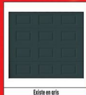
Existe en gris